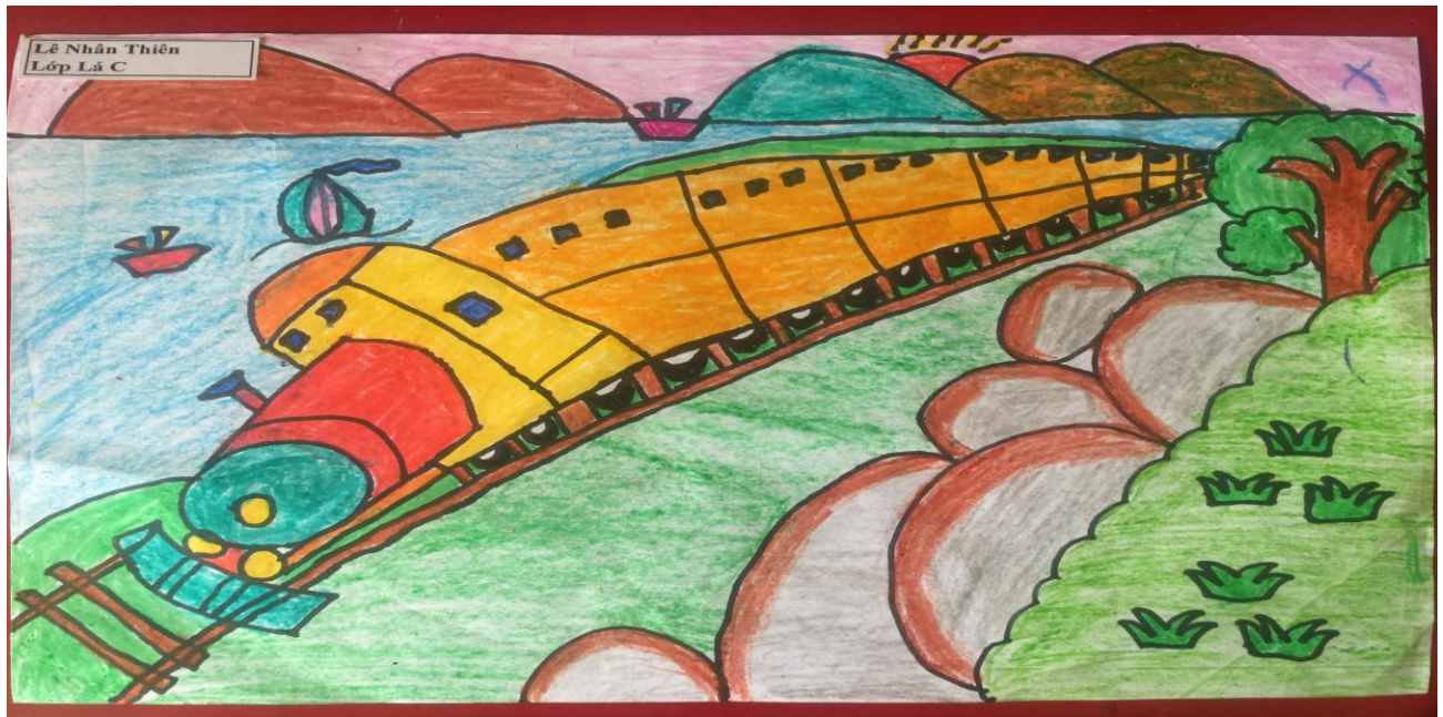
Cháu: Lê Nhân Thiên , 5 tuổi - Vẽ chủ đề “Giao thông”