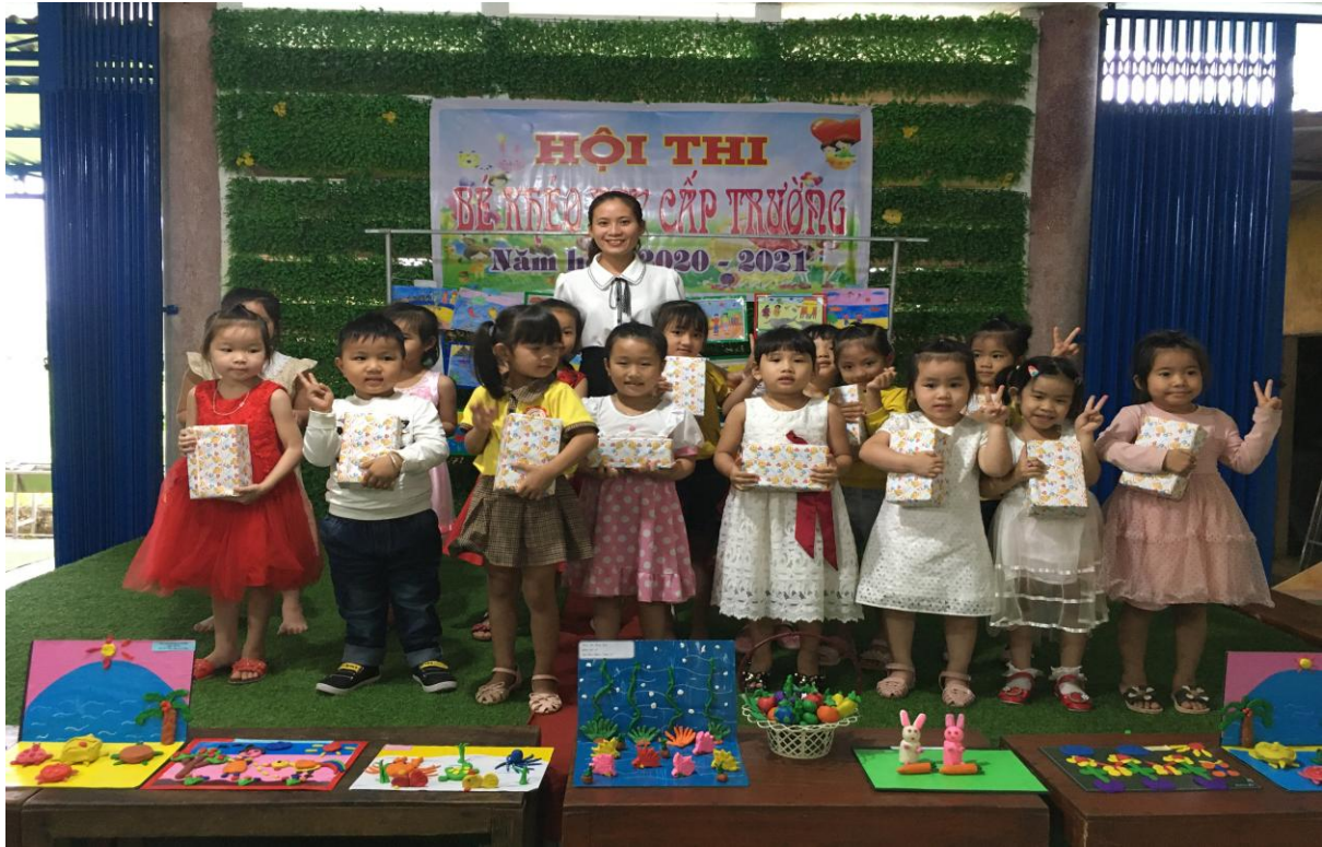
Các cháu đạt giải Ba trong hội thi