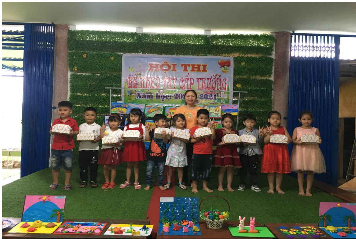
Các cháu đạt giải Nhì trong hội thi