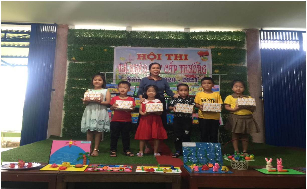
Các cháu đạt giải Nhất trong hội thi